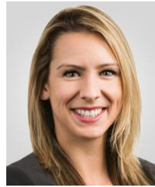
Ruth Ellen Brosseau

Churchill - Keewatinook Aski (Manitoba) Porte-parole, Emplois et développement de la main d'œuvre.